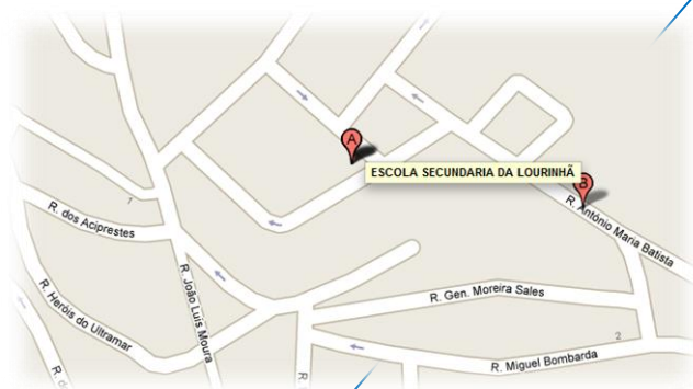
Escola Secundária da Lourinhã